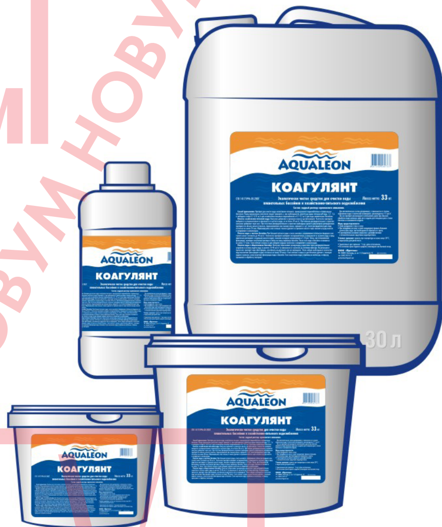
Фасовка жидкого средства: бутылка 1 л и канистра 30 л Фасовка таблетированного средства: ведро 1,5 кг и 4 кг

Очистка воды в общественном бассейне: Коагулянт впрыскивают дозирующим устройством (жидкий) либо помещают необходимое количество таблеток в скиммер или автодозатор из расчета 10-40 мл / 10-20 г на 1 м 3 (в зависимости от мутности) до песчаного фильтра. Не допускается пропускать препарат через фильтрацию, если фильтр на диатомите или на картриджах. После набора необходимого количества воды выключают фильтрацию и дают отстояться не менее 20 минут. Слой хлопьев и взвеси со дна бассейна удаляют с помощью водного пылесоса, затем включают фильтрацию воды в бассейне. Если помутнение воды устранено не полностью, то фильтр промывают и обработку повторяют.