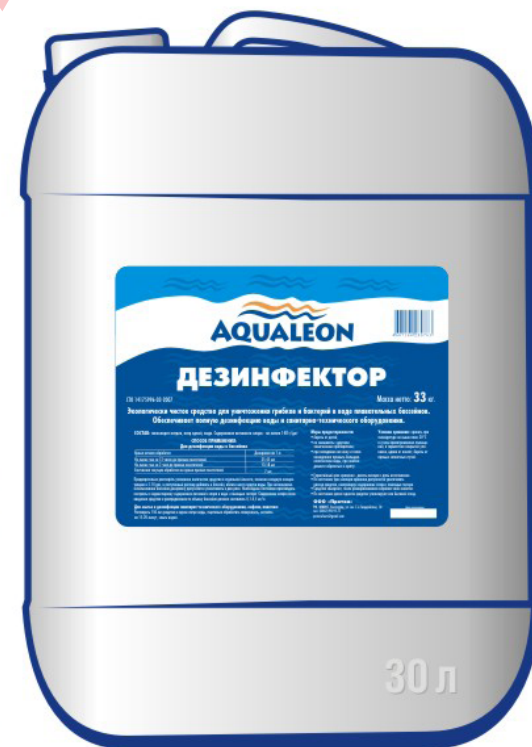
Фасовка: канистра 30л