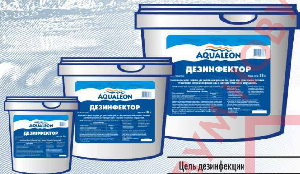
Фасовка: ведро 1 кг, 5 кг и 10 кг

Способ применения: предварительно растворить гранулы в воде в отдельной ёмкости, полученный раствор порциями добавить в бассейн, вблизи места подачи воды или в нескольких местах одновременно во время работы циркуляционного насоса. Обеспечить значение pH воды бассейна в пределах 7,2-7,6. Применять в зависимости от степени загрязненности воды в соответствии с таблицей: